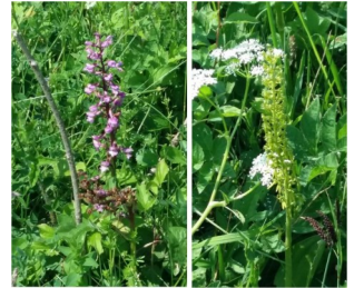
Knabenkräuter: Zwei unserer heimischen Orchideen-Arten

Vor allem freute sich die Gruppe über besonders wertvolle, weil geschützte Pflanzen, wie z.B. die Schwalbenwurz, verschiedene Orchideen, wie das grüne und das gefleckte Knabenkraut, und das "bleiche Waldvögelein", allesamt in voller Blüte. Die Mitglieder der Gruppe waren sich einig, dass sie viele der Pflanzen seit ihrer Kindheit vom Sehen her kannten, aber nicht wussten, ob sie essbar oder giftig, schädlich oder geschützt sind. Allerdings war es wegen der unglaublichen Vielfalt kaum möglich, sich all die Namen zu merken. Damit man das alles in Zukunft nachschlagen kann, wurde wieder fleißig fotografiert